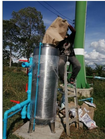
โครงการติดตั้งเครื่องกรองน้ำใช้ประปาหมู่บ้าน หมู่ที่ ๑๖ (ศาลาประชาคมหมู่บ้าน)