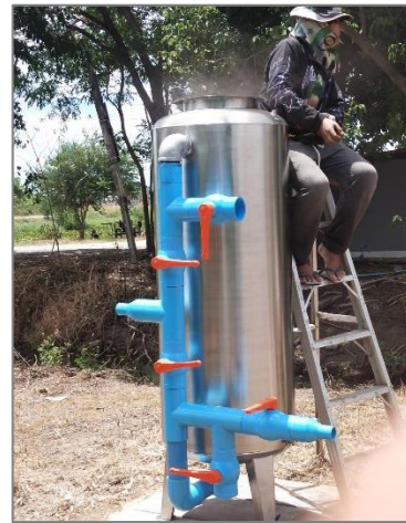
โครงการติดตั้งเครื่องกรองน้ำใช้ประปาหมู่บ้าน หมู่ที่ ๗ (ตรงข้ามโรงงานซ้อใหญ่)