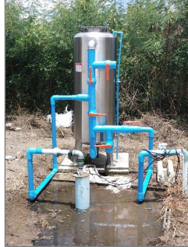
โครงการติดตั้งเครื่องกรองน้ำใช้ประปาหมู่บ้าน หมู่ที่ ๖ (ศาลพ่อปู่ จุดที่ ๒)