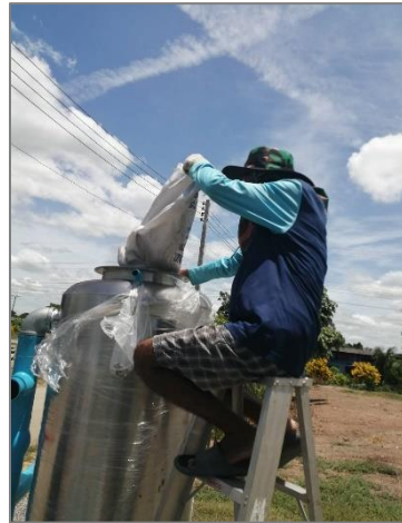
โครงการติดตั้งเครื่องกรองน้ำใช้ประปาหมู่บ้าน หมู่ที่ ๑๕ (ไถ่ฟาร์มกุ้ง)